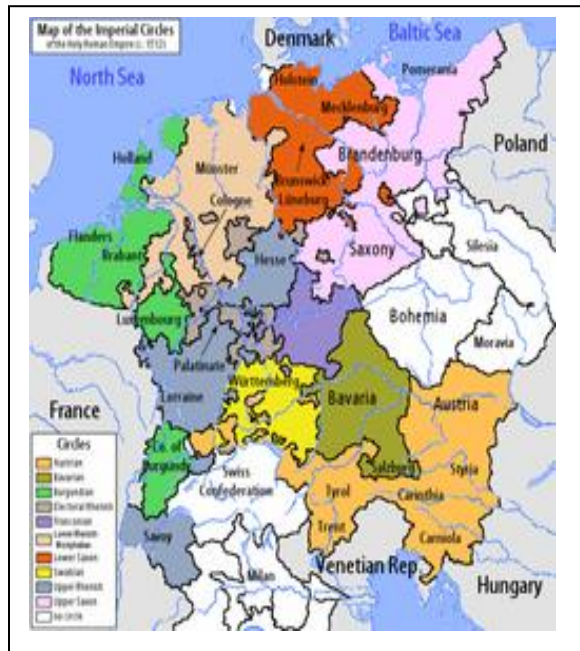
Imperio con la división en circunscripciones de 1512.