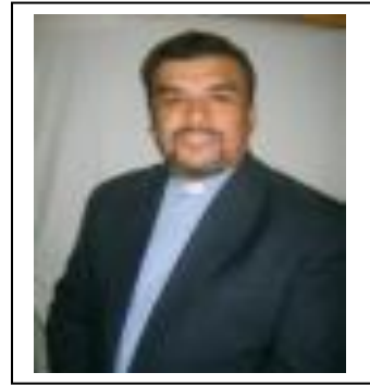
Autor: Pablo Núñez Córdova.