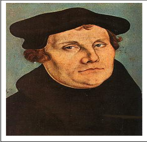
Martín Lutero. Pintado por Lucas Cranach el Viejo.