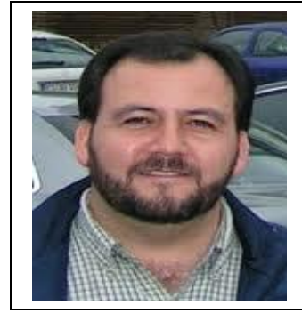
Autor: Pastor y Misionero Andrés Casanueva N.