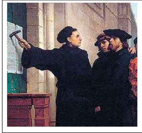
Martín Lutero clava las 95 tesis.